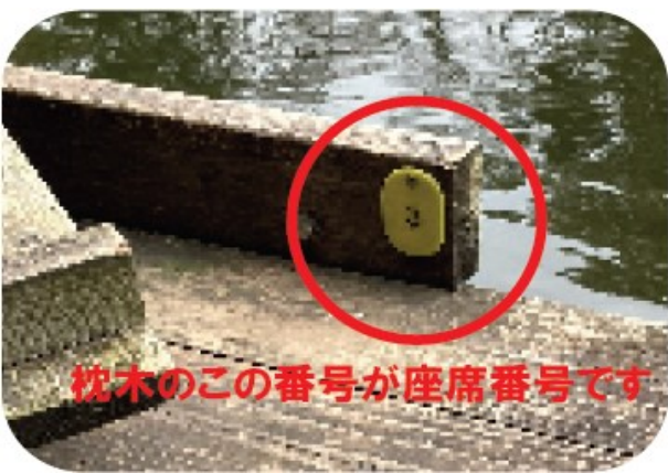
枕木のこの番号が座席番号です

ブロック内占有率とは、各ブロックの1位の釣果の割合に近い上位2位のこと。1位（100％）の数字に近ければ近いほど予選通過率が高い。 例を確認すると、2ブロックのA氏が占有率が98.8%なので予選通過率は非常に高い。